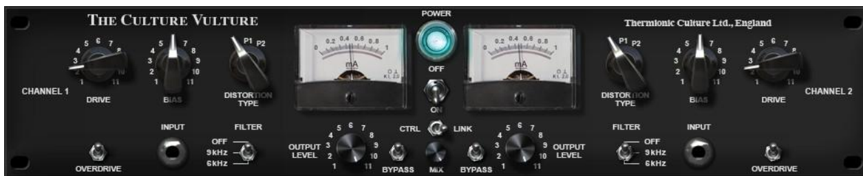
Thermionic Culture Vulture プラグイン・ウィンドウ