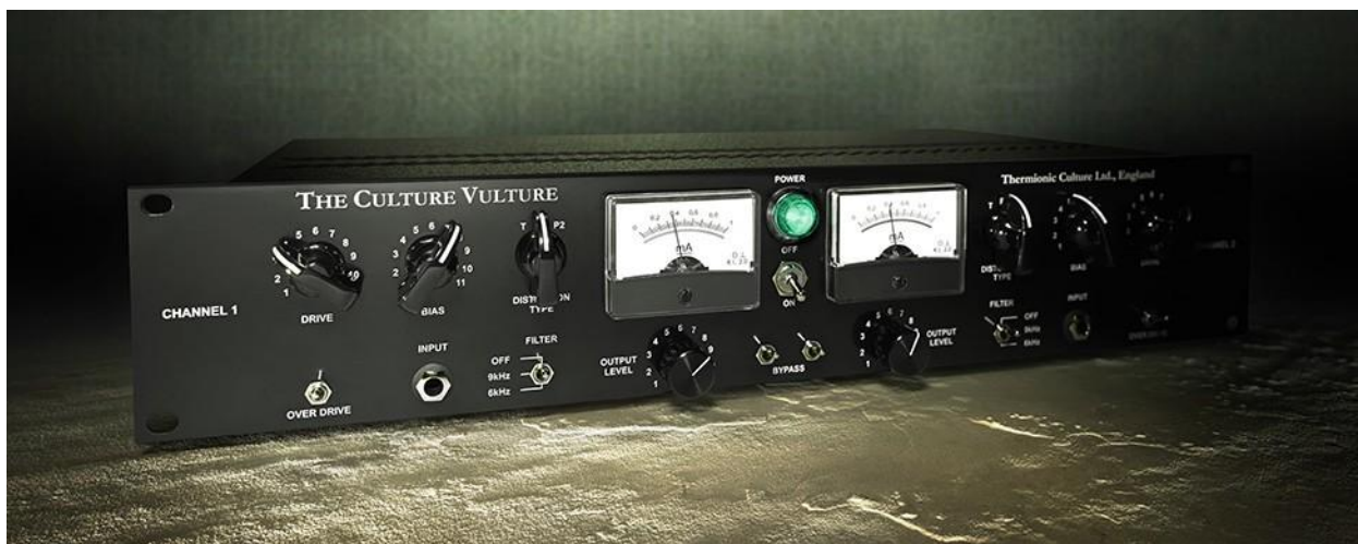
Thermionic Culture Vulture ハードウェア・ユニット