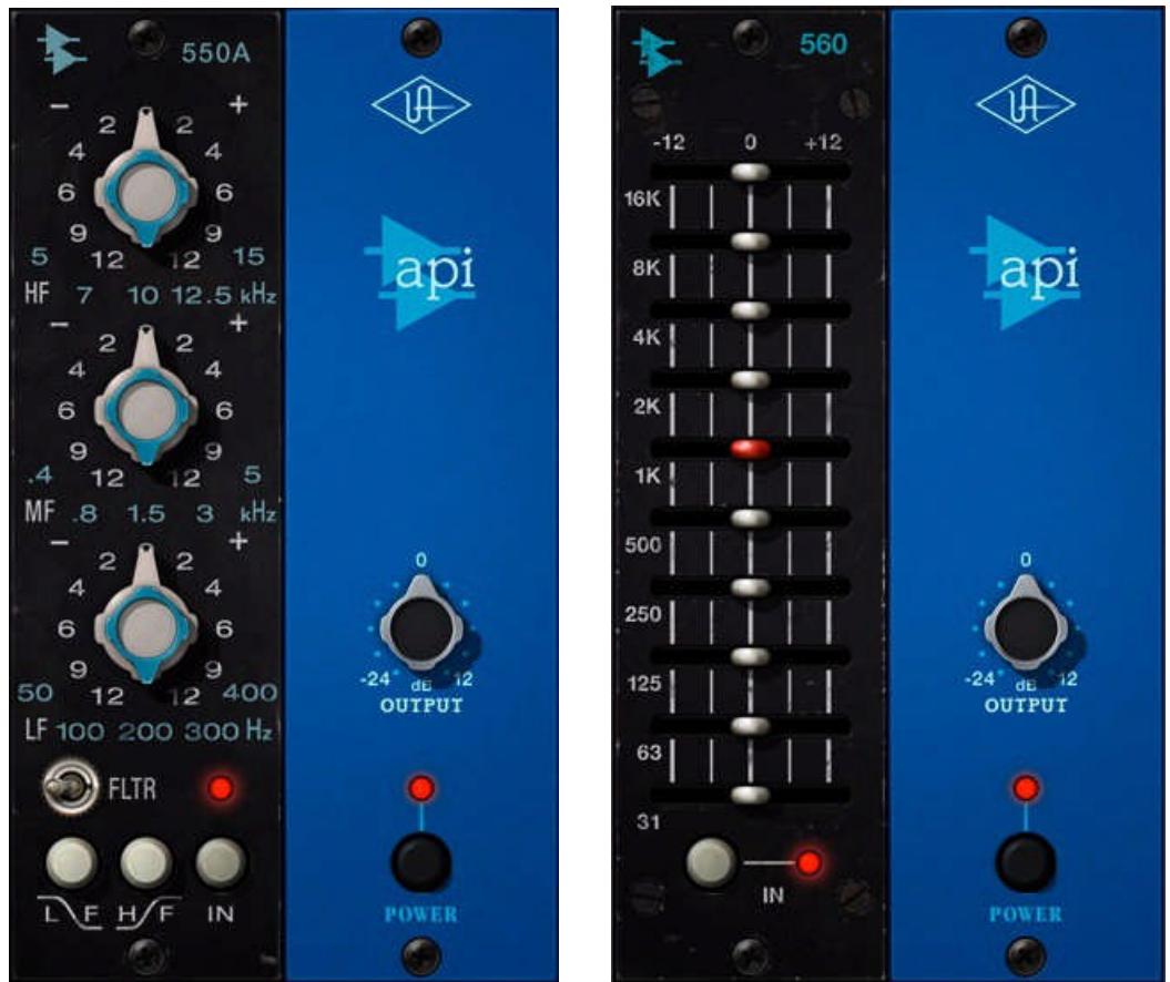
Figure 5. API 550A EQ (左)、API 560 EQ (右) プラグインウィンドウ