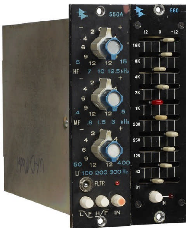
API 500 Series EQ Collection オリジナルハードウェア

550Aは、同社が1971年に製造を開始したAPIのコンソールの標準的なチャンネルモジュールEQになりました。業界は急速に550Aの音質を受け入れ、Frank DeMedioや他の多くのエンジニア達が自分のカスタムコンソールへの導入を始めました。これらのコンソールの多くは、今日でも使用されています。40年後の現在でも550Aは、他のEQが測定するスタンダードのままです。そしてそれは何十年の間、レコード産業で主役を演じていました。売約済みのすべてのユニットとこのEQの人気による需要でAPIは2004年について生産を再開しました。