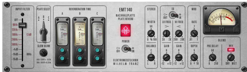
図 123. UAD EMT 140 プラグインウィンドウ